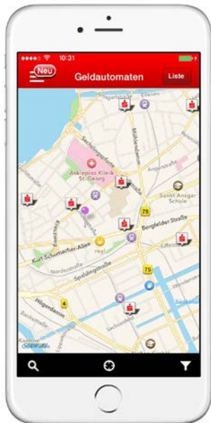
„Filialfinder“-App der Sparkassen