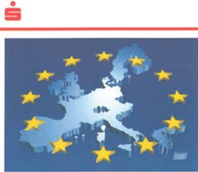
Kundenbroschüre zum Euro, 1996

Der Euro Chancen und Risiken einer gemeinsamen Währung in Europa