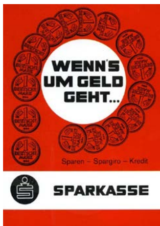
Plakat mit dem Slogan „Wenn's um Geld geht ...“, 1965