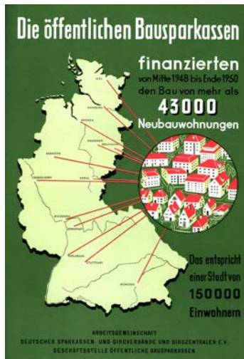
Werbung der Landesbausparkassen, 1951