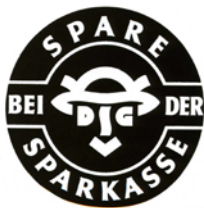
Verbandszeichen des DSGV, 1925

1924 In Berlin fusioniert der Deutsche Sparkassenverband mit dem 1916 errichteten Deutschen Zentralgiroverband und dem Deutschen Verband der Kommunalen Banken zum Deutschen Sparkassen- und Giroverband (DSGV).