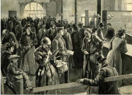
Kunden in der Sparkasse der Stadt Berlin, 1894 (Zeichnung von A. Kiekebusch)