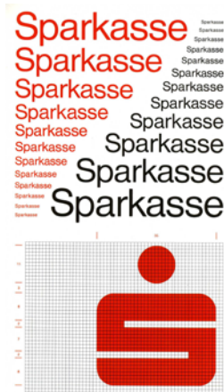
Entwurf für das einheitliche Erscheinungsbild der Sparkassen, 1972

1971-1980 Die Sparkassen weiten ihre Produkt- und Dienstleistungspalette aus. Sie sind Vorreiter bei der Automatisierung von Bankgeschäften und bei der Kundenselbstbedienung: Nach ersten Versuchen in den 1960er Jahren beginnen sie Mitte der 1970er-Jahre, Geldautomaten und Kontoauszugsdrucker aufzustellen.