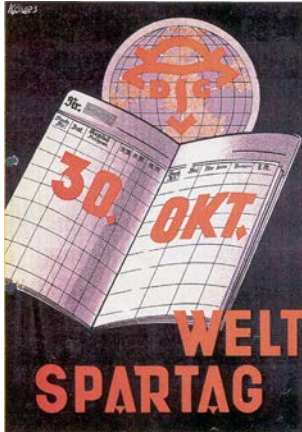
Weltspartagsplakat, um 1930