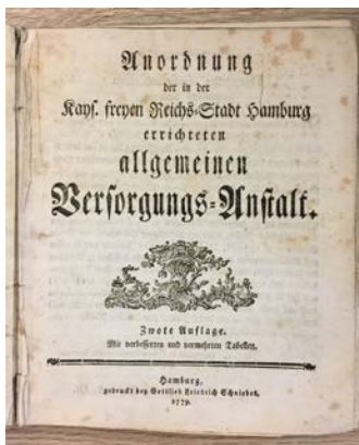
Satzung der Hamburgischen Allgemeinen Versorgungsanstalt, 2. Aufl., 1779

Seit über 200 Jahren haben die Institute der Sparkassen-Finanzgruppe auf vielfältige Weise dazu beigetragen, gesellschaftlichen und wirtschaftlichen Wandel zu gestalten. Sie bieten eine breite Palette moderner Finanzdienstleistungen flächendeckend für alle Bevölkerungsschichten und Unternehmen – insbesondere aus Mittelstand, Handwerk und Handel – an.