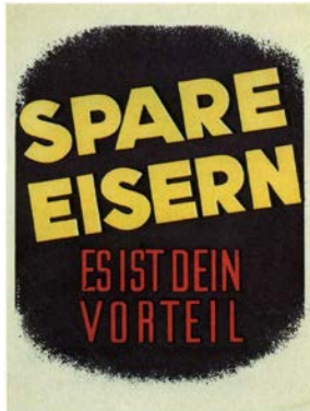
Werbung für das Eiserne Sparen, 1940er-Jahre