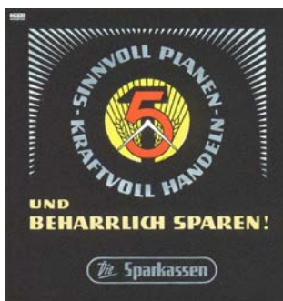
Kino-Werbung der DDR-Sparkassen, 1951